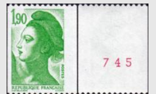
(9) « Liberté de Gandon » YT No 2426