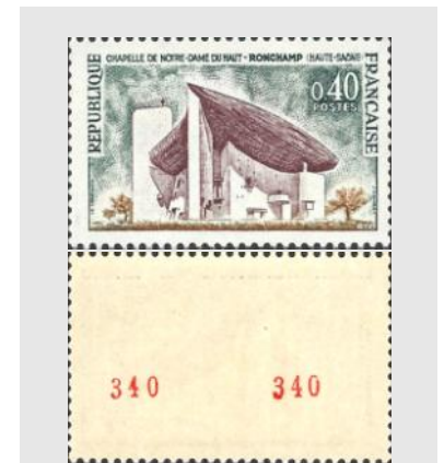
(6) « Chapelle de Notre-Dame du Haut à Ronchamp » 0,40 F YT No 1435a

https://fr.wikipedia.org/wiki/Rouleau_de_timbres