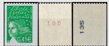
(10) La « Marianne de Luquet » YT No 3458 est à la fois la dernière roulette avec numérotation rouge et la première avec numérotation noire