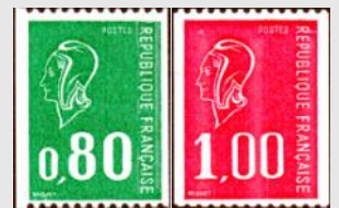
(8) « Marianne de Béquet » YT No 1894 et 1895