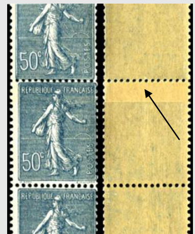
(3) Raccord de deux bandes de timbres reliées par un morceau de la marge inférieure.