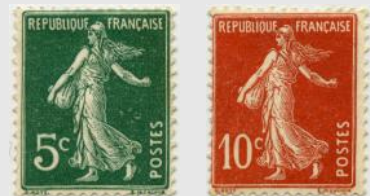
(2) Les deux premiers timbres français conditionnés en roulettes (YT No 137 (type I) et 138 (type IA))