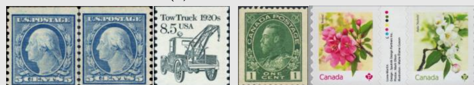
(13) Etats-Unis 1919-1987