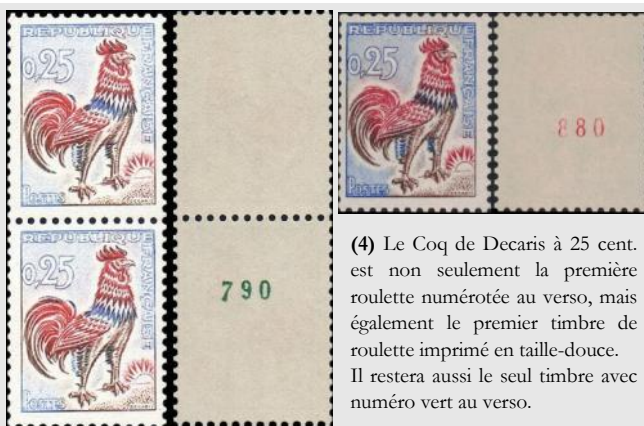
(4) Le Coq de Decaris à 25 cent. est non seulement la première roulette numérotée au verso, mais également le premier timbre de roulette imprimé en taille-douce. Il restera aussi le seul timbre avec numéro vert au verso.