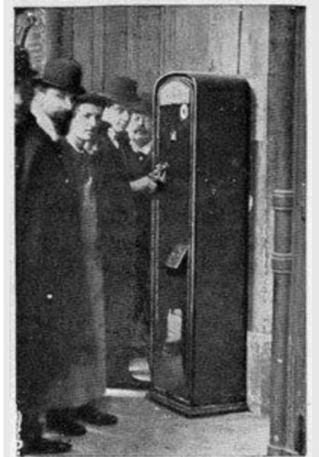
(1) 13 mars 1908 - Mise en service du premier distributeur automatique de timbres à Paris.

A partir de 1962, et pour faciliter la comptabilité des stocks, un timbre de roulette sur dix porte un numéro au verso imprimé en typographie sur la gomme. Le premier timbre ayant bénéficié de cette évolution est le coq de Decaris à 25 centimes n°1331. D'abord de couleur verte, ce numéro fut ensuite imprimé en rouge (5) .