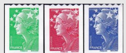
(11) Les roulettes auto adhésives ont fait leur apparition avec la « Marianne de Beaujard » YT No ADH 219, 220, 221