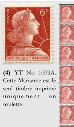
(4) YT No 1009A. Cette Marianne est le seul timbre imprimé uniquement en roulette.