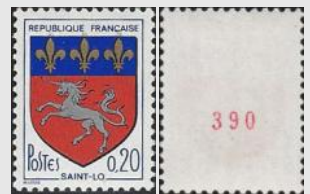
(7) « Blason de Saint-Lô » YT No 1510b sans bandes de phosphore