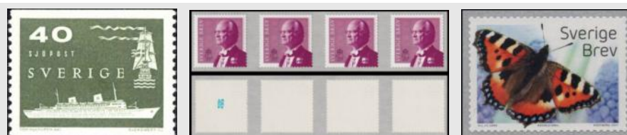
(12) Suède 1958 - 2015 - 2017