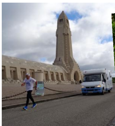
devant l'ossuaire de Douaumont