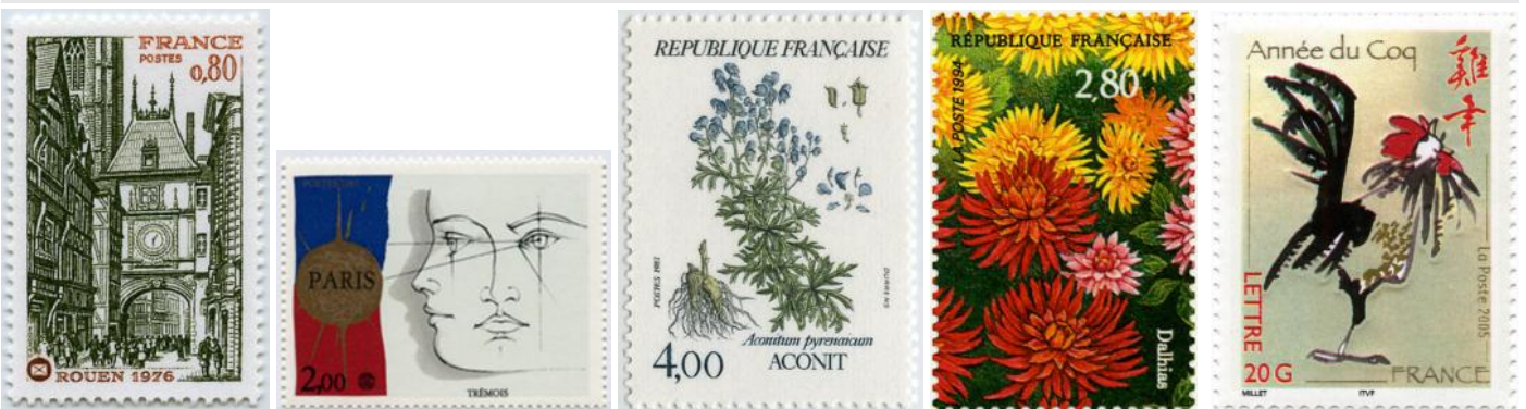
(1) Y.T. No 1875

Les gagnants recevront un lot philatélique.