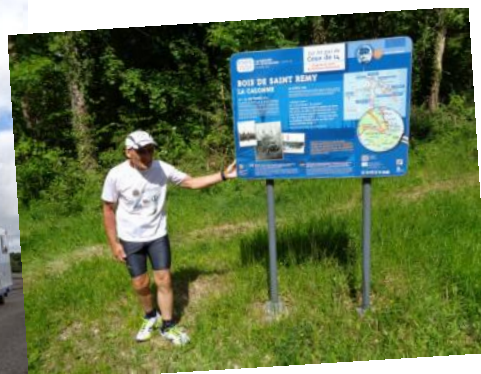
à la Tranchée de Calonne