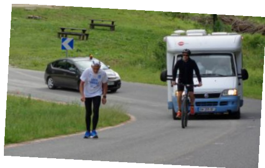
sur la route entre Louvemont et Douaumont