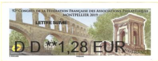
Patrice MICHELET

Rendez-vous l'an prochain à Paris du 11 au 14 juin 2020 au parc des expositions Porte de Versailles.