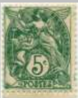
(4) timbre de 1900