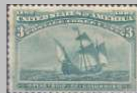
(13) Etats-Unis - timbre de 1892