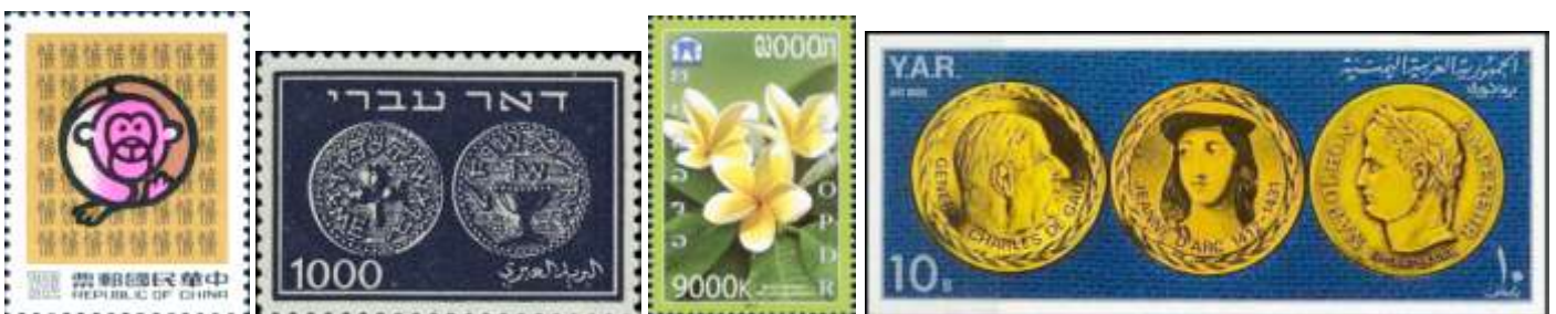
Timbre no 1