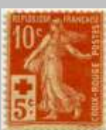
(10) timbre de 1914