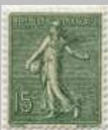
(7) timbre de 1903