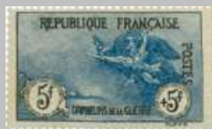
(11) timbre de 1917