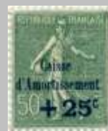
(12) timbre de 1927