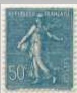
(8) timbre de 1938