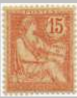
(5) timbre de 1900