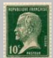
(14) timbre de 1923