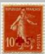
(9) timbre de 1914