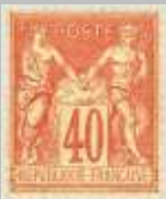
(3) timbre de 1881