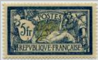
(6) timbre de 1900