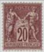
(3) timbre de 1876