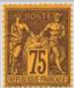
(3) timbre de 1890