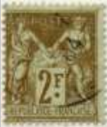
(3) timbre de 1900