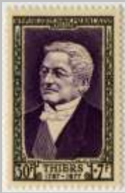
(1) timbre de 1952

A suivre dans la prochaine Lettre d'Information