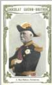
(2) carte de collection