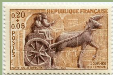
(3) France 1963 : La poste gallo-romaine