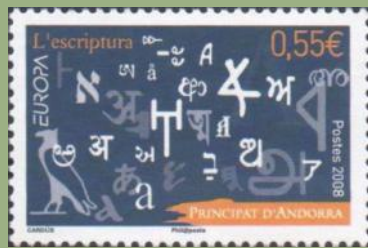
(1) Andorre 2008 : L'écriture