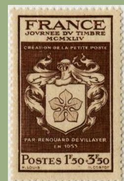
(8) France 1944