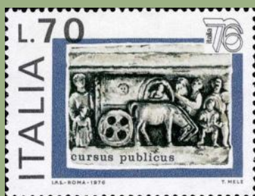
(4) Italie 1976 : Le cursus publicus

Service de poste impérial organisé sous Auguste, le cursus publicus fonctionnait grâce à une série de gîtes d'étape ( mansiones ) et de postes relais intermédiaires ( mutationes ) le long des voies romaines. D'autres appellations sont courantes : statio (étape, relais), taberna (auberge), praetorium (hébergement pour voyageurs de marque).