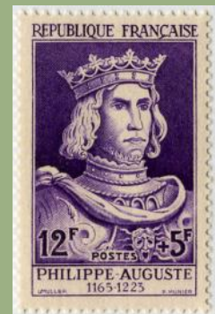
(5) France 1955

C'est sous ce régime que se trouvait cette administration quand fut votée la loi du 30 août 1848, fixant à un tarif uniforme pour toute l'étendue du territoire le port des lettres d'un même poids, et décrétant la création et la mise en vente de timbres-poste (9) à dater du 1er janvier 1849.