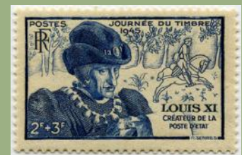
(6) France 1945