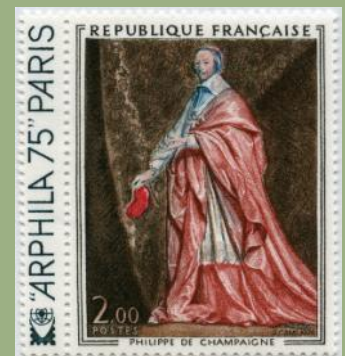
(7) France 1974