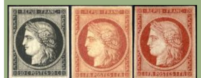
(9) France 1849