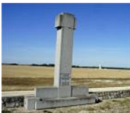
Monument à la mémoire d'Emile Mayrisch le long de la route entre Chalons-en-Champagne et Thibie (D933)

Question 2 : Que signifie l'abréviation NDO ?